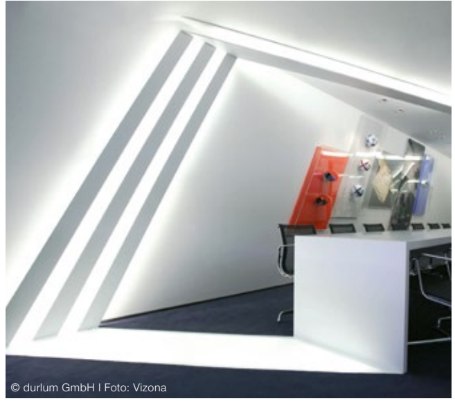
Innenleuchten Interior lighting