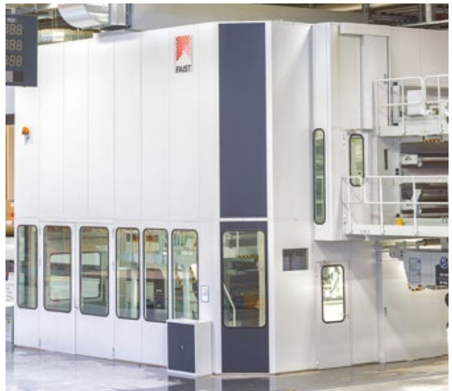
Metaldecken und Raumsysteme Ceiling panels and room systems