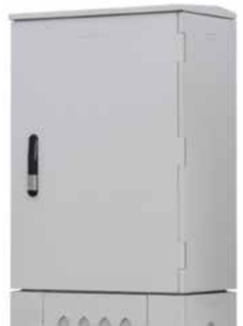
Dauerhafter Schutz der SMC-Bauteile durch PIMC-Beschichtung

Unsere Experten besuchen Sie gern, um mit Ihnen über ein individuelles PIMC-Konzept zu sprechen.