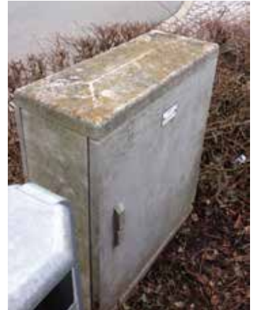
„Blooming“ und starke Verschmutzung nach einigen Jahren

Für das Entformen wird kein zusätzliches Trennmittel benötigt. Das Lacksystem ist umweltfreundlich, lösemittel- und styrolfrei. Zusätzlicher Handling- und Logistikaufwand z.B. zur internen Lackieranlage oder zum externen Lohnbeschichter entfällt.