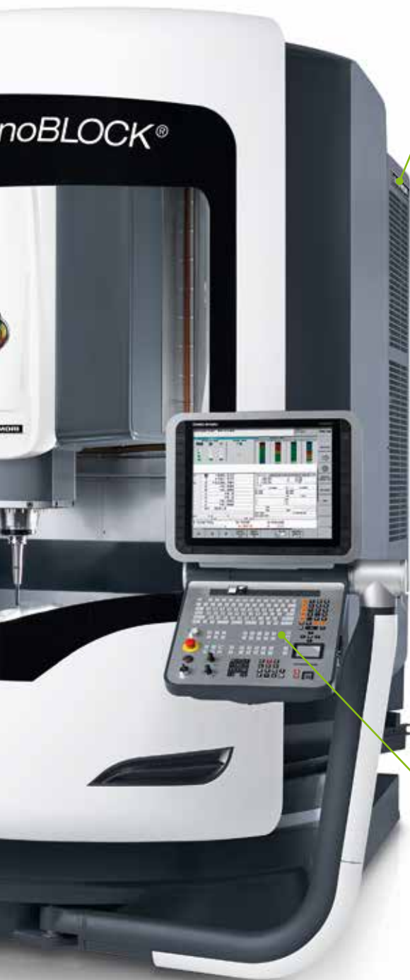
Schaltschrank Switch cabinet